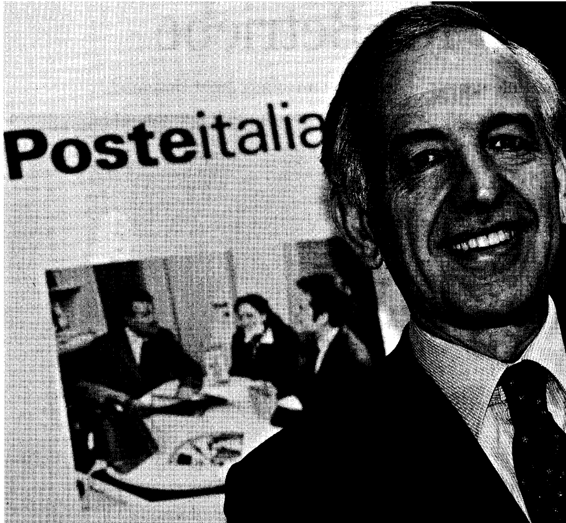
Massimo Sarmi, Vorstandschef der Poste Italiane: Die italienische Post ist dreimal so rentabel wie die Deutsche Post.

Der Vorstandsvorsitzende der Poste Italiane, Massimo Sarmi, setzt künftig auf neue Dienstleistungen und High-Tech